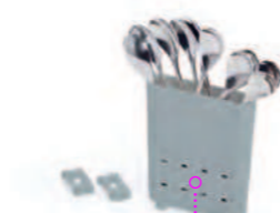
Держатель для столовых приборов