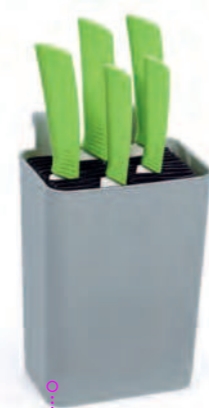
Блок для ножей со вставкой-гормшкой