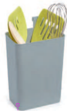
Держатель для кухонных принадлежностей