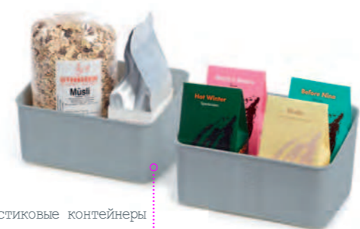
Пластиковые контейнеры для хранения