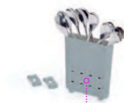
Держатель для столовых приборов